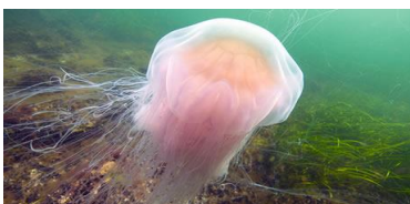
Gelbe Haarqualle (Cyanea capillata)

Jeder hat es schon erlebt, aber was ist das beste Mittel beim Kontakt mit einer Feuerqualle?